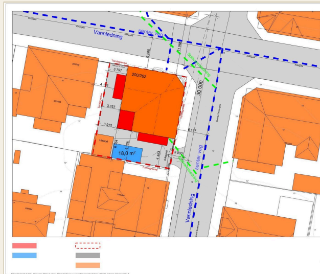
SITUASJONSPLAN 1:200 · ARTIKON AS